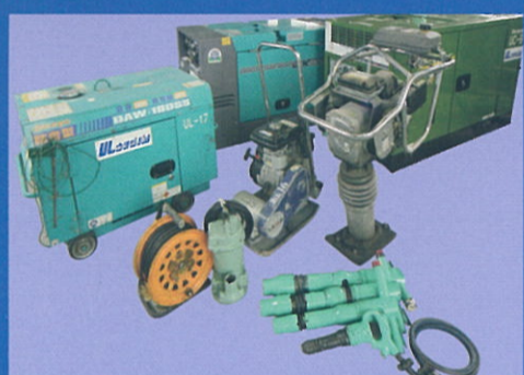
ウェルダー コンプレッサー プレートランマー