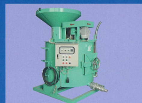
1 ton フレコンプラント