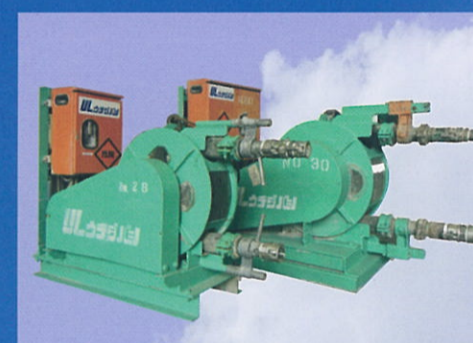
チューピングポンプ