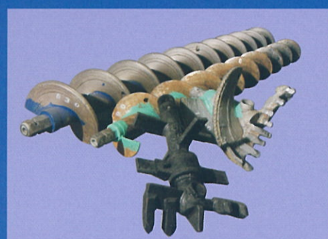
スクリューヘッド