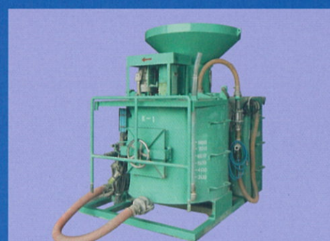
チューピングポンプ付 1 ton フレコンプラント